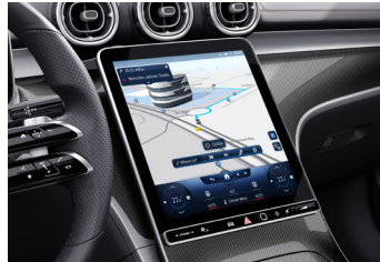
MBUX på dansk. Det ubetinget mest formfuldende infotainmentsystem til dato er blevet endnu bedre og forstår nu dansk. Sig blot ordene 'Hej Mercedes' – og systemet er klar til at hjælpe dig.