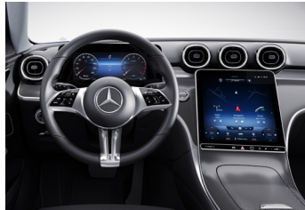
Digitalt cockpit. Instrumentdisplayet på 12,3" og det trykfølsomme mediadisplay på 11,9" gør det nemt at holde overblikket over alt fra navigation og radio til kørecomputer og underholdning.